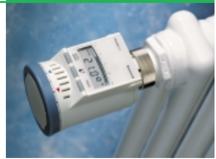
Honeywell Rondostat: zeitgesteuerter Heizkörperregler. Die Elektronik erfüllt individuelle Heizwünsche.

Besonders hervorzuheben und einmalig im Test ist der Heimeier-Thermostatkopf: Auf ihn ist eine Kurzanleitung aufgedruckt. Sie erklärt in Briefmarkengröße, aber trotzdem klar und deutlich die Skala und die Symbole. Bei den anderen findet sich die Bedienungsanleitung nur auf der Verpackung oder hängt lose am Ventil. Nach der Montage wandert sie dann meist in den Müll.